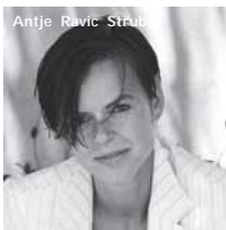
Antje Ravic Strubel